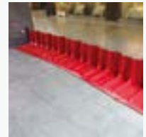
複合ビルへの浸水対策設置例

ボックスウォールを並べるだけで高さ50cmまでの水の侵入を防ぎ、積み方に習熟を要する土のうと比べて簡単に設置できます。