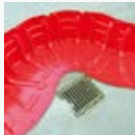
人孔の溢水対策設置例

豪雨によるマンホールからの激しい溢水に対しては堤防背面に漏水することなく堰き止め、また合流下水道マンホールから溢水した雑排水をグレーチングに導くことができた。